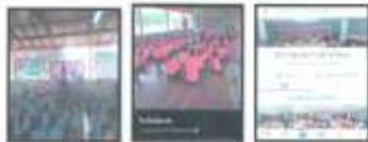
- ប្រធាន គ្រប់កម្រិត ត្រូវបាន ដឹកនាំដោយប្រឹក្សាភិបាល ក្នុងការអនុវត្តផែនការយុទ្ធសាស្ត្រ និង គោលនយោបាយ របស់ អង្គការកម្ពុជា ដល់ គោលដៅកម្រិត