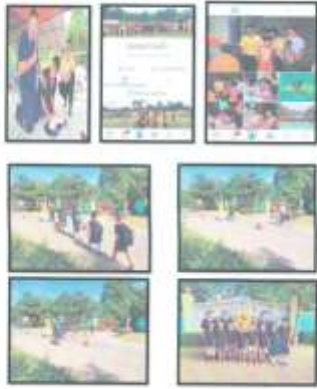
វិធានការ ១ ការងារ ៦ ក្នុងត្រីមាស ១ ឆ្នាំ ២០២២ របស់គណៈកម្មាធិការក្រសួងសុខាភិបាល ក្រសួងស្ថាប័នស្រុក និង គណៈកម្មាធិការស្រុក ក្នុងការអនុវត្តវិធានការ ១ របស់គណៈកម្មាធិការក្រសួងសុខាភិបាល ក្រសួងស្ថាប័នស្រុក និង គណៈកម្មាធិការស្រុក