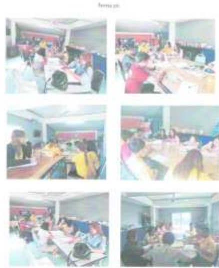
វិធានការ ២