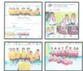
វិធានការ ៣ ការងារ ៦ ក្នុងត្រីមាស ១ ឆ្នាំ ២០២២ របស់គណៈកម្មាធិការក្រសួងសុខាភិបាល ក្រសួងស្ថាប័នស្រុក និង គណៈកម្មាធិការស្រុក ក្នុងការអនុវត្តវិធានការ ៣ របស់គណៈកម្មាធិការក្រសួងសុខាភិបាល ក្រសួងស្ថាប័នស្រុក និង គណៈកម្មាធិការស្រុក