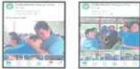
- ប្រធានដំបូងបង្អស់ ទទួលបានជោគជ័យ ក្នុងការដឹកនាំក្រុមប្រឹក្សាភិបាល ក្នុងការអនុវត្តផែនការយុទ្ធសាស្ត្រ និង គោលនយោបាយ របស់ អង្គការកម្ពុជា ដល់ គោលដៅកម្រិត