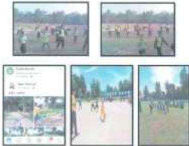
វិធានការ ២ ការងារ ៦ ក្នុងត្រីមាស ១ ឆ្នាំ ២០២២ របស់គណៈកម្មាធិការក្រសួងសុខាភិបាល ក្រសួងស្ថាប័នស្រុក និង គណៈកម្មាធិការស្រុក ក្នុងការអនុវត្តវិធានការ ២ របស់គណៈកម្មាធិការក្រសួងសុខាភិបាល ក្រសួងស្ថាប័នស្រុក និង គណៈកម្មាធិការស្រុក